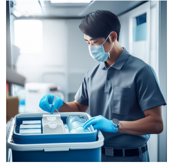
冷凍・冷蔵を必要とする 医薬品の配送