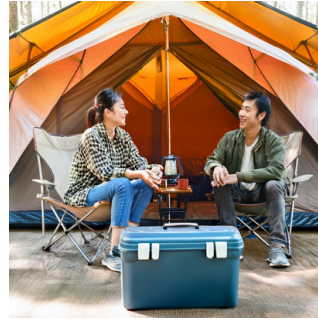
アウトドア(キャンプなど)